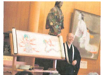
道成寺絵解き説法