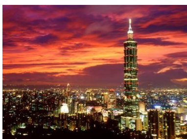
台北市内 & 台北101の夜景