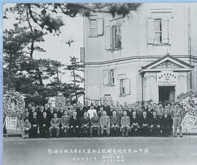
1948年 神戸中華青年会が移情閣に孫文「天下為公」碑を設置。