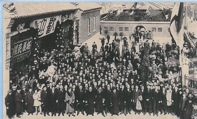
1913年 神戸の神阪中華会館で孫文を歓迎する華僑。